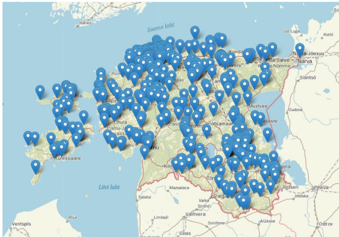
Suvised aialinnuvaatluse vaatluspaigad Eestis 2024. aastal.

Vaatluspaigad olid jaotunud üle kogu Mandri-Eesti ja kolme suursaare (Saaremaa, Hiiumaa, Muhumaa). Väikesaartest täideti aialinnupäevikut vaid Vilsandil. 44% jälgitavatest aedades asusid Harju- või Tartumaal. Kõige vähem jälgitavaid aedu oli Valgemaal, Jõgevamaal ja Ida-Virumaal.